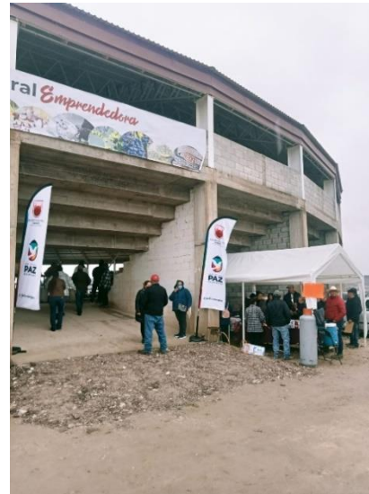
Expo Tianguis Agropecuario Miguel Auza. 26 y 27 de febrero 2024.